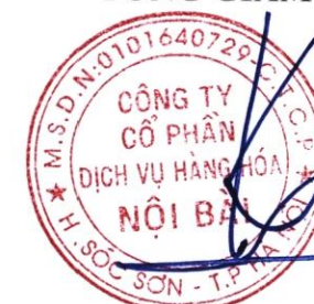
Đào Mạnh Kiên