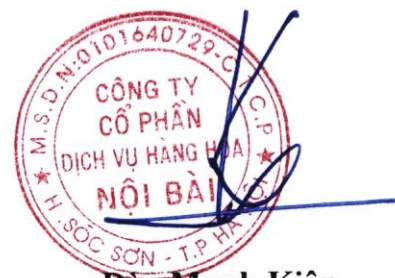
Đào Mạnh Kiên